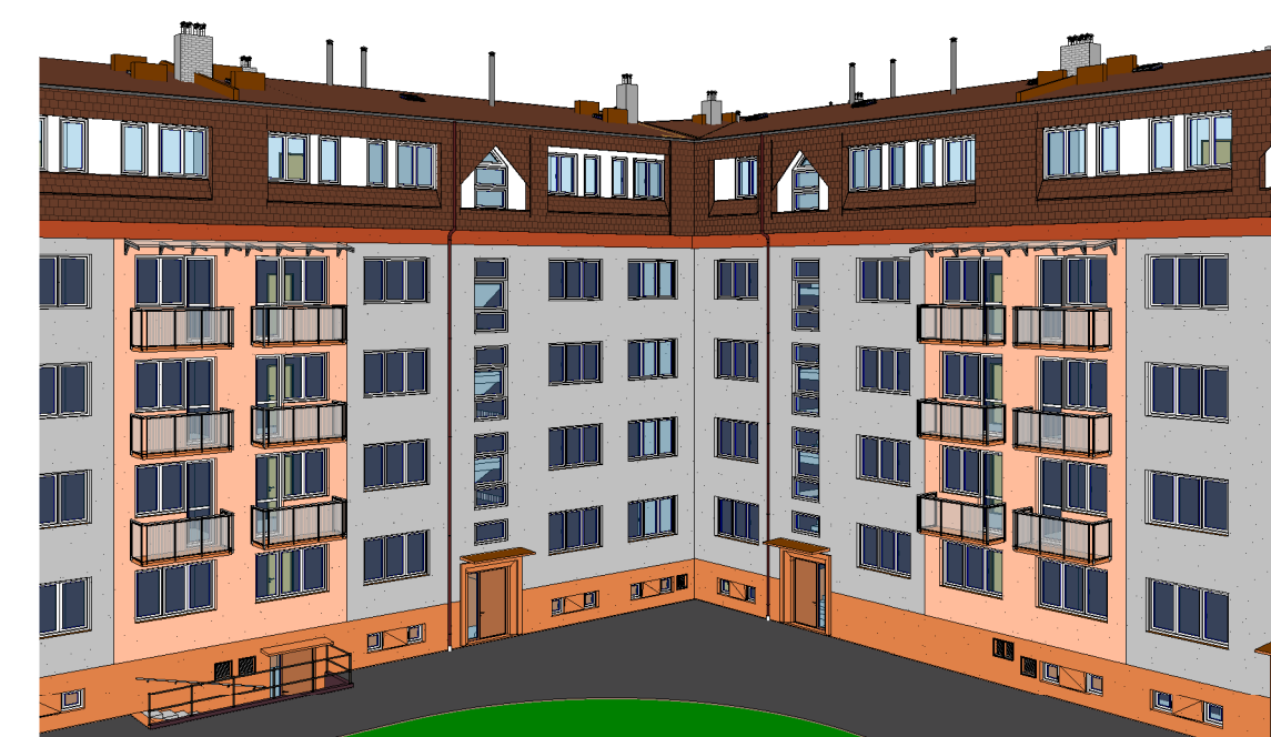
2 3D pohled 2_SS