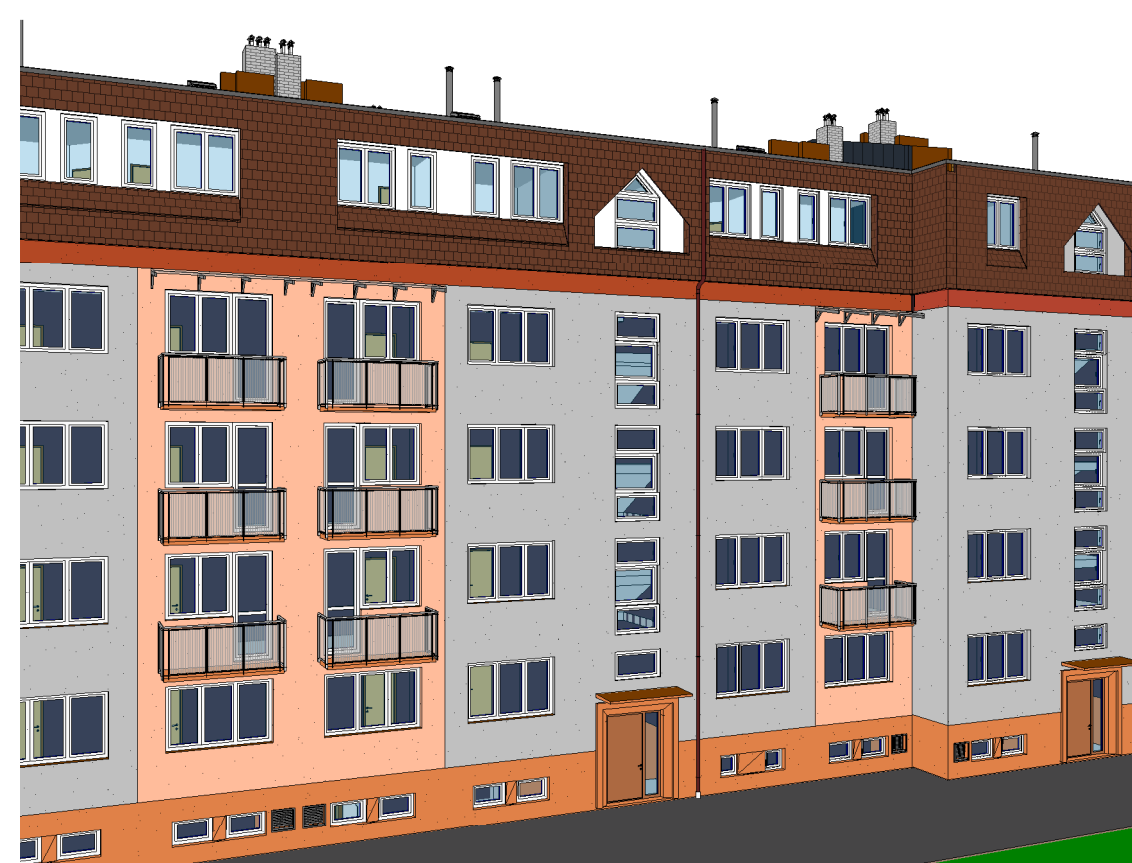
4 3D pohled 4_SS