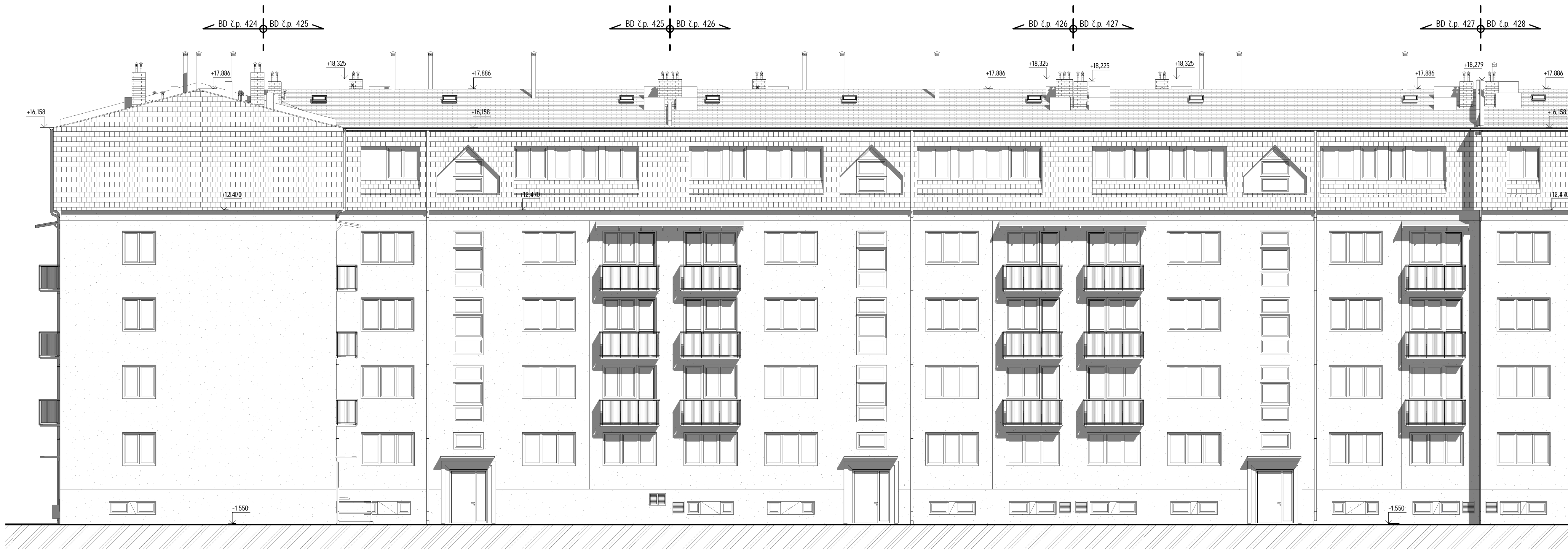
1 Pohled zadní 1 : 100